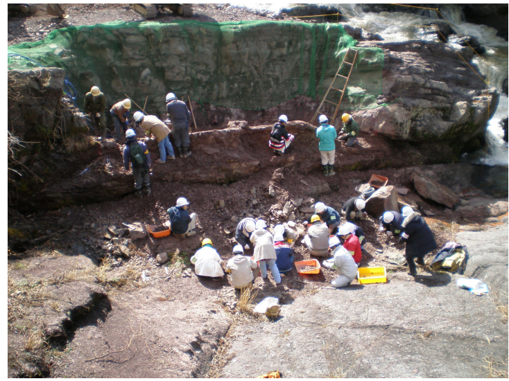
【第1次発掘調査の様子】